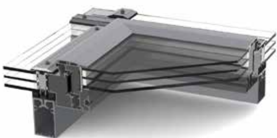
LAMILUX Lüftungsflügel PR60 Variante 1

Mit umlaufender Deckleiste für Dachneigungen von 8° bis 75°