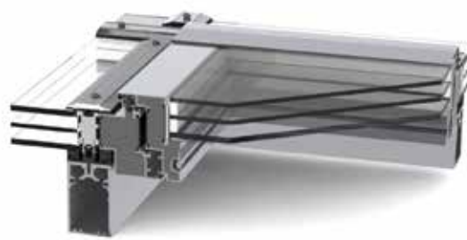
LAMILUX Lüftungsflügel PR60 Variante 2

Mit umlaufender Deckleiste für Dachneigungen von 8° bis 75°